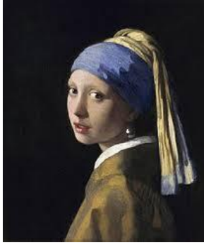
Het meisje met de parel van Vermeer