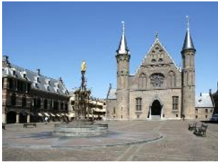
Het Binnenhof in Den Haag