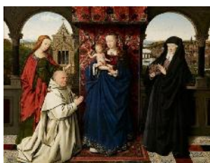
Madonna met kind van Jan Van Eyck

Zelden leent de vermaarde Frick Collection van New York werken uit aan andere musea. Het is de eerste grote tentoonstelling in Europa met werken uit 'de Frick'. 36 Topstukken staan in Nederland waaronder de Madonna met kind, de heilige Barbara, Elisabeth van Hongarije en Jan Vos van Jan Van Eyck. We bezochten ook de vaste collectie van het Mauritshuis met Vermeer, Jan Steen, Rubens, Rembrandt, Van Dyck, Brueghel, Van der Weyden, Paulus Potter en vele anderen. Een rondleiding door het Nederlandse politieke Binnen- en Buitenhof stond ook op onze agenda.