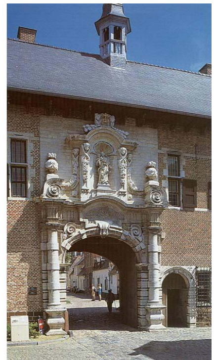
De toegangspoort van het Begijnhof